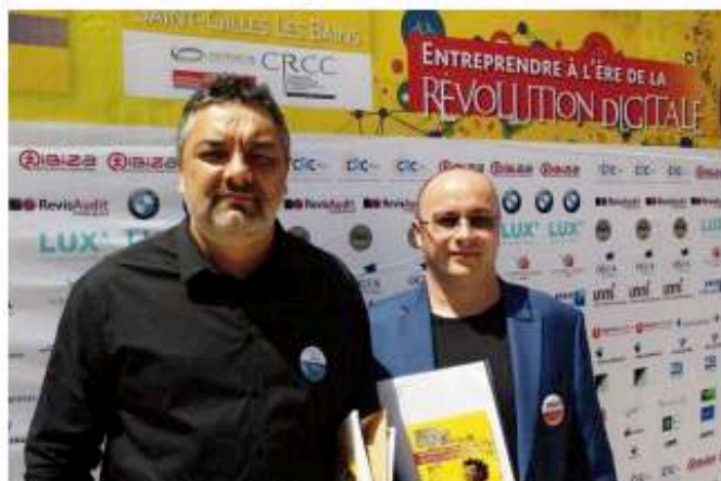
Pour le président régional de l'Ordre des experts comptables (à droite), ce métier ne va pas disparaître.

- Présent récemment au Congrès des experts-comp-